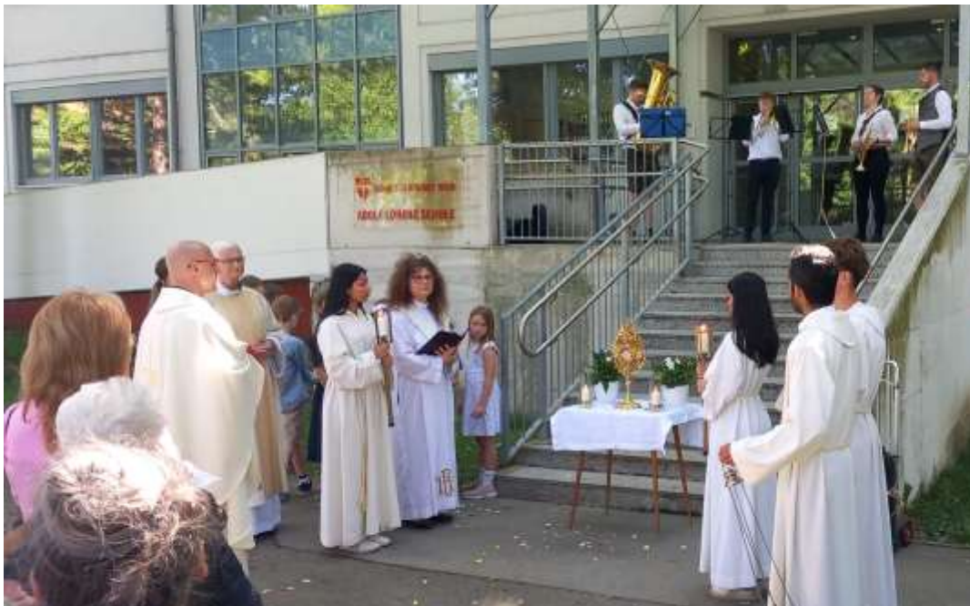
Die Prozession = das „nach außen gehen“!

„Geduld ist das Schwerste und das Einzige, was zu lernen sich lohnt. Alle Natur, alles Wachstum, aller Friede, alles Gedeihen und Schöne in der Welt beruht auf Geduld, braucht Zeit, braucht Stille, braucht Vertrauen.“